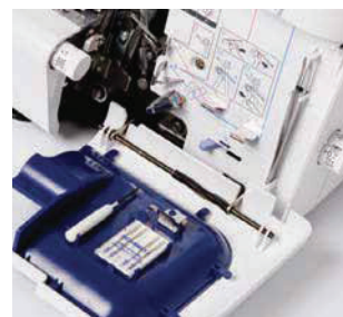
Встроенный отсек для хранения принадлежностей