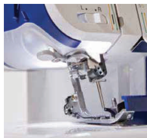
LED подсветка рабочей зоны