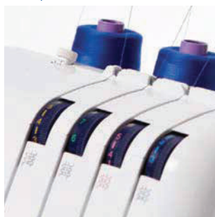
4 цветных направляющих для удобной заправки нитей