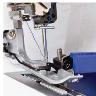
Автоматическая заправка нитей